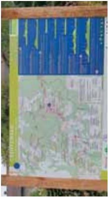
Les bords de la l'église Saint-Croix

La déchèterie intercommunale Rue de St-MALO à CREUTZWALD cf. plan au verso